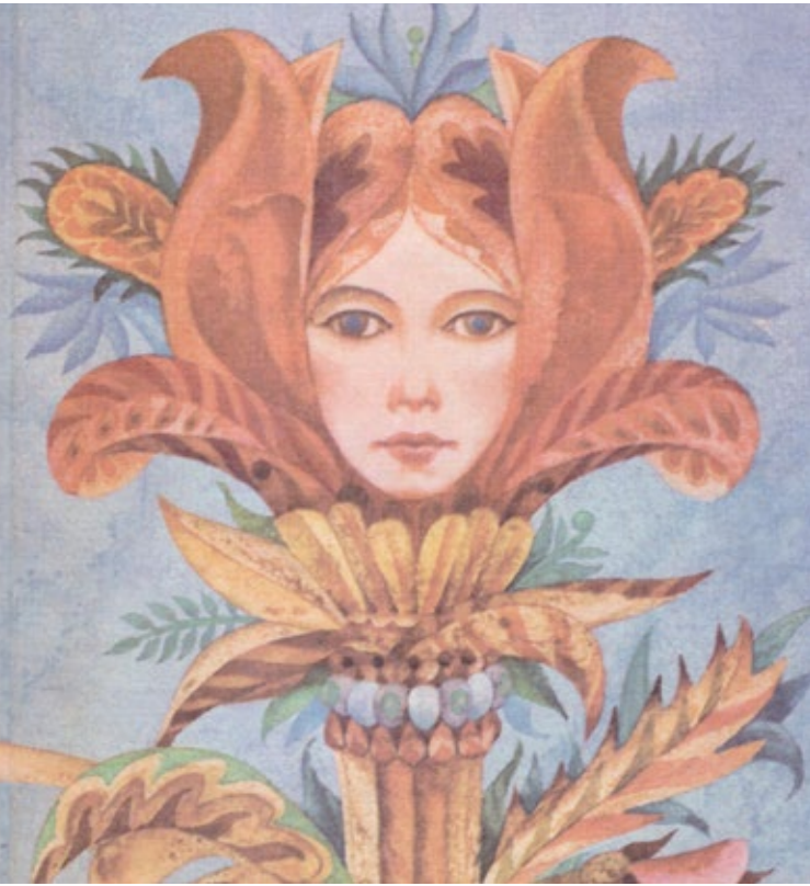
Aus dem Titelbild der „Blumenmärchen“ von Anna Sakse

wird in die wispernden Repetitionen des Wortes „Komm“ („Nac“) gelegt, die der Männerchor vorträgt, darüber singen die Frauen den Text des Gedichts. Schließlich vereinen sich Männer und Frauen im dritten Abschnitt des Liedes, zuerst singend, dann