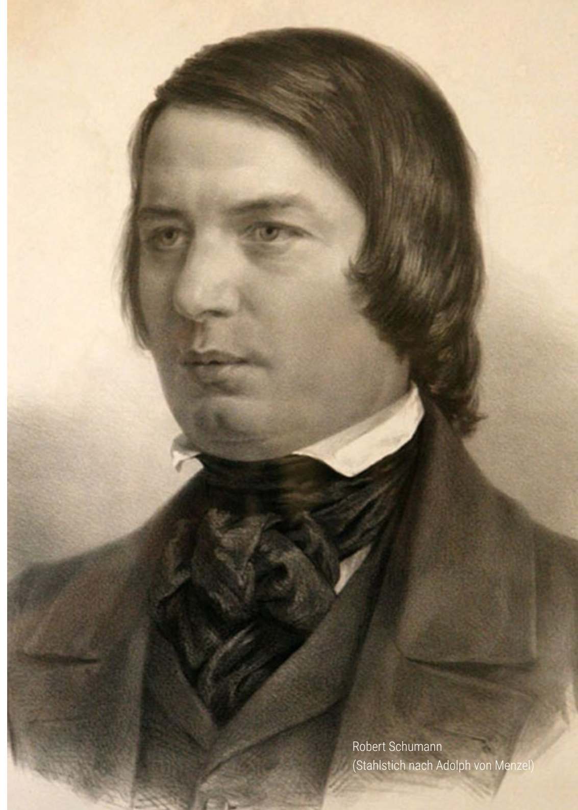
Robert Schumann (Stahlstich nach Adolph von Menzel)

1841 wurde für Robert Schumann, der sich neue Gattungen nun systematisch erarbeitete, geradezu zum „Sinfonienjahr“: Januar/Februar entstand die Erste Sinfonie B-Dur op. 38 (die sogenannte „Frühlingssinfonie“), April/Mai Ouvertüre, Scherzo und Finale (bei diesem eher locker gefügten Werk war sich Schumann nicht sicher bezüglich der Gattungszugehörigkeit, er bezeichnete es sowohl als „Suite“, „Symphonette“, aber auch als „2te Sinfonie“). August/September 1841 arbeitete Schumann dann an seiner eigentlichen zweiten Sinfonie in d-moll, die allerdings nach der wenig erfolgreichen Uraufführung am 6. Dezember 1841 und dem erfolglosen Versuch, das Werk drucken zu lassen, erst 1851 nach tiefgreifender Umarbeitung als Vierte Sinfonie op. 120 veröffentlicht wurde. In chronologischer Reihenfolge stellt Schumanns 1845/46