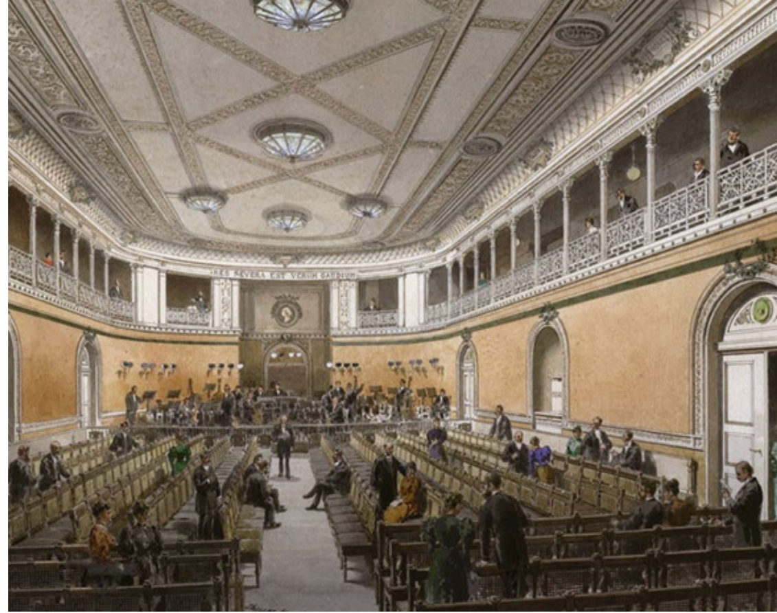
Saal im Alten Gewandhaus Leipzig (Aquarell 1895)

Einen Neuanfang für Schumann eröffneten dann allerdings die Anfang 1845 zusammen mit seiner Ehefrau Clara betriebenen intensiven Kontrapunktstudien: In der erneuten Auseinandersetzung mit dem verehrten Johann Sebastian Bach geriet Schumann in eine wahre „Fugenpassion“, die sich in Werken wie den Sechs Fugen für die Orgel über B-A-C-H op. 60 niederschlug. In diesem Zusammenhang überdachte Schumann auch grundlegend seine Kompositionsweise, seine bisherige Angewohnheit, „... Alles, das kleinste meiner Stücke in Inspiration, ... vieles in unglaublicher Schnelligkeit“ zu schreiben, wich nun dem Bestreben, neue Werke gründlich „im Kopf zu erfinden und auszuarbeiten“.