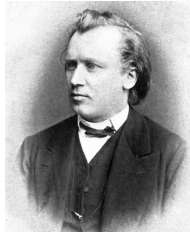
Brahms zur Zeit der Haydnvariationen