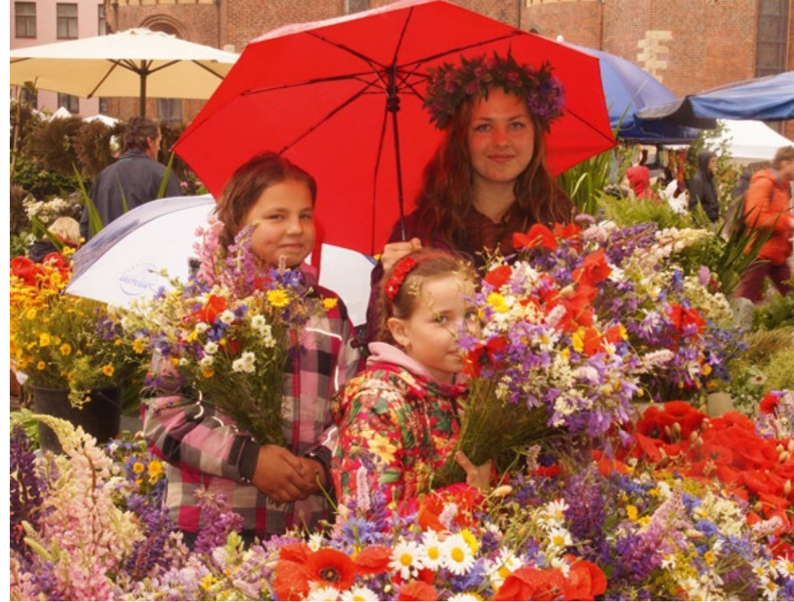
Līgo-Vorfreuden auf dem Blumen- und Kräutermarkt in Riga (2014)

Das Fundament der aktuellen Freuden sind aber immer noch die alten Geschichten – zum Beispiel eben das „Waldhyazinthen“-Märchen. Darin verliert der Jüngling Jāņis seine Geliebte Zane auf tragische Weise: Das Mädchen, in dessen rechtschaffenes und anmutiges Wesen sich Jāņis schnell verliebt hat, sammelt zum Broterwerb für die Familie Kräuter und Blumen, gerät jedoch durch seine häufigen Aufenthalte in der Natur in der Bannkreis eines Waldgeistes, der „alt und scheußlich wie ein Baumknorren“ ist und das Herz der jungen Frau natürlich nicht erobern kann. Deshalb greift er – ausgerechnet in der Johannisnacht – zu einer üblen List: Er lockt Zane mit dem besonders intensiven Duft einer geheimnisvollen Pflanze, das Mädchen will die Blume für ihren Geliebten holen und bleibt im Gehege des Waldgeistes gefangen. Jāņis sucht nun sehnsuchtsvoll nach seiner Liebsten, er findet sie aber nur in Gestalt einer Waldhyazinthe wieder, die er aus Ehrfurcht vor den Geschöpfen der Natur nicht pflückt. Genau darin liegt die Tragik des Märchens: Hätte Jāņis die Blume gebrochen, wäre Zane ihm wiedergegeben worden.